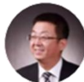
曹洪欣 教授/副秘书长 中华中医药学会 中医药现代化研究与规划