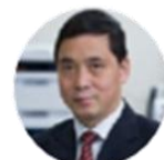
吕爱平 教授/院长 香港浸会大学中医药学院, 香港 中医证候研究及指南制定

Integrate the best of Chinese and Western Medicine to improve health and wellness